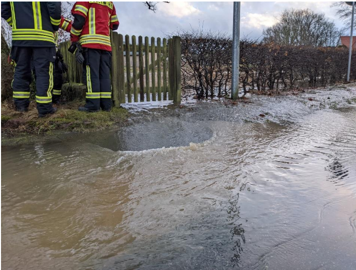
Der Dorfteich in Quarrendorf lief über und überflutete die Straße