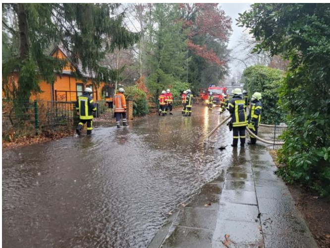
Wie hier in Asendorf wurden zahlreiche Straßen durch die starken Regenfälle überflutet

Freiwillige Feuerwehr SG Hanstedt Pressesprecher NORD